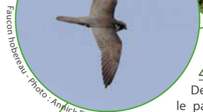
Faucon hobereau

Ce schéma est donné à titre indicatif et ne remplace pas une carte de terrain.