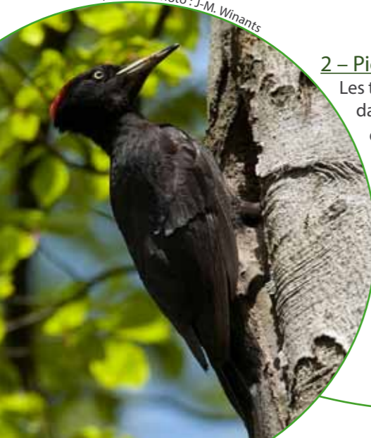
Pic noir

Les trois espèces de pics protégées par Natura 2000 sont présentes dans les forêts de ce site. Il s'agit, du plus grand au plus petit, du pic noir , du pic cendré et du pic mar. Les deux premiers forent le bois mort en tambourinant avec leur bec puissant pour déloger des larves et pour creuser une cavité qui abritera leur nichée, criblant les arbres d'une multitude de larges trous bien visibles. Le pic mar, au bec plus fin, ne creuse que rarement pour se nourrir, mais déniche ses proies en picorant sur les branches et sous les écorces. Pour percer son nid, il choisit un arbre bien pourri.