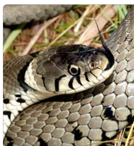
La couleuvre à collier est inoffensive.

Contact et informations : www.natagora.be/reserves/haute-sure