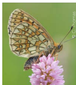
Le nacré de la bistorte : sa plante hôte apprécie les sols humides et acides.