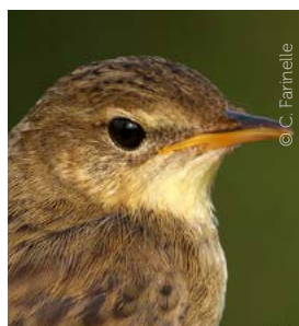
La locustelle tachetée vit cachée dans la végétation des marais.