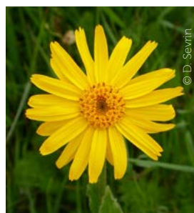
L'arnica des montagnes, recherché pour ses propriétés médicinales.